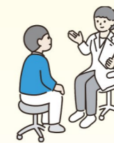
臨床心理士による カウンセリング