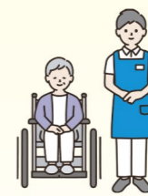
介護と仕事の 両立支援