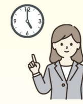
就業時間内の 会議終了の徹底