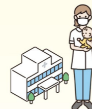
病児保育施設等 利用助成

大学ならではの制度として、ライフイベントを抱えた研究者に研究補助員を配置することで、研究者を支援すると同時に、学生の研究力向上にもつながっています。