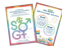
SOGIガイドライン・ SOGI対応事例集の発行

このガイドライン策定は、学生団体「ilma」の結成にもつながりました。「ilma」は、セクシュアルマイノリティの当事者が安心して過ごせるキャンパスづくりを目指して、SOGIやLGBTへの理解促進のための活動を行うなど、ダイバーシティ推進室との協働イベントを精力的に実施しています。