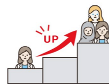
女性・若手・外国人研究者比率の向上