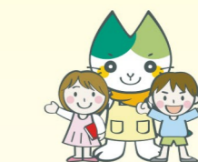
学童保育 「ヤマミ学級」・ 一時保育の実施