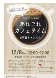
あれこれカフェタイムの開催